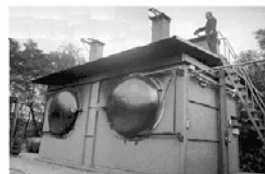
Procédé de chauffage externe

Il existe plusieurs technologies de fabrication de charbon à partir de la biomasse. Ces technologies se distinguent l'une par rapport à l'autre par le concept de fabrication, le mode de chauffage (chauffage interne, chauffage externe et chauffage avec recirculation des gaz de combustion de vapeurs pyrolytiques), la pression (pression atmosphérique, pression partielle des vapeurs formées, haute pression...), la matière première utilisée (granulométrie, essences de bois, bois recyclé...) et l'application du charbon fabriqué (industrie métallurgique, usage domestique, fabrication de carbures...).