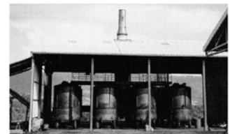
Procédé de chauffage interne